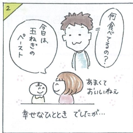
イラスト by のぶすなちえ (こぶしの家)